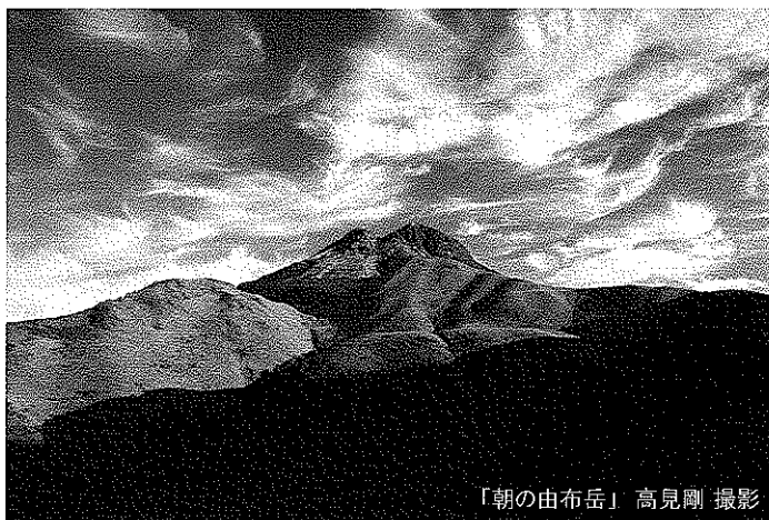
「朝の由布岳」