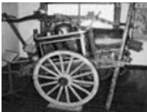
▲手押しポンプ 明治35年に作られた手押しポンプです。左右から合計12人の手により動かします。