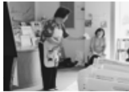
▲ 定例おはなし会にて