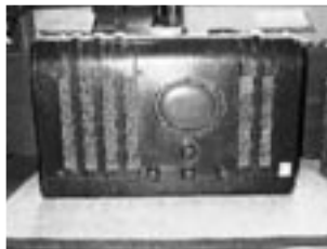
▲ラジオ 縦24cm横52cm高さ33cmのラジオです。今から60年も前に作られたものです。