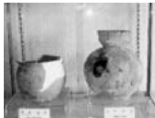
▲北原 弥生式土器 挾間町田野小野の田んぼから出土した、弥生式土器です。今から1700年ほど前のものです。