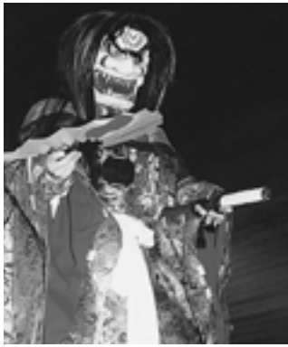
◀ 昨年の庄内神楽祭りから