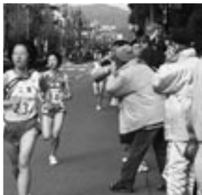
▶前のランナーをとらえた瞬間です