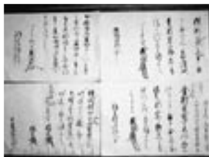
▲甲斐家文書 大友宗麟や宗麟の父親・義鑑が挾間の甲斐氏に送った手紙です。今から440年前の貴重な中世文書です。