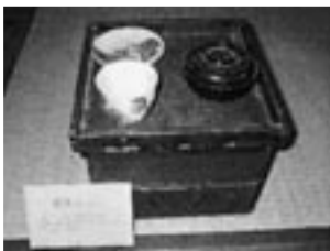
▲箱膳 箱膳といって一人一人がお茶わんや箸などを入れる道具です。食後は自分で洗ってなおします。