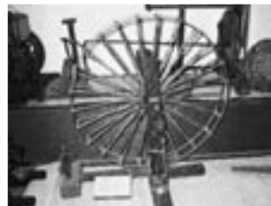
▲糸車 綿を取って糸を取る道具です。手で糸にしたものを巻いていきます。