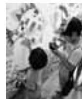
▲ 由布川峡谷に飾られる予定の看板。