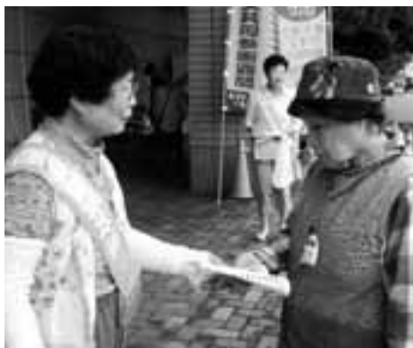
◀男女共同参画社会の実現に向けて

6月26日、市男女共同参画審議会委員の皆さんと女性団体連絡協議会の皆さんが、市と協力して市内の各スーパーで男女共同参画に関するパンフレットやティッシュを配布し、普及・啓発活動を行いました。これは6月23日～29日の「男女共同参画週間」を受けて実施されたもので、イオン挟間店、マルミヤストア庄内店、Aコープゆふいん店の3ヵ所で呼びかけを行いました。