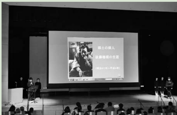
▲ならねっ子まつりでナレーションを務めるジュニアリーダーの皆さん