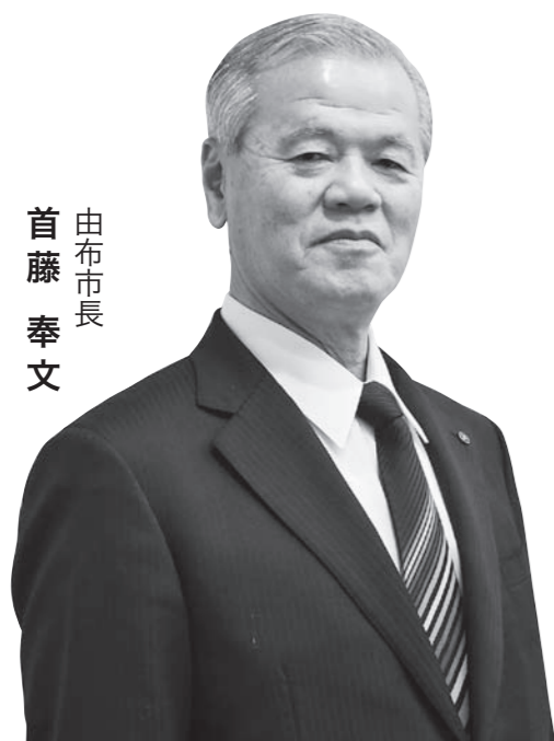
由布市長 首藤 奉文

議員各位をはじめ、市民の皆さまのご理解とご協力を心からお願ひ申し上げます。平成27年度の施政方針とさせていただきます。