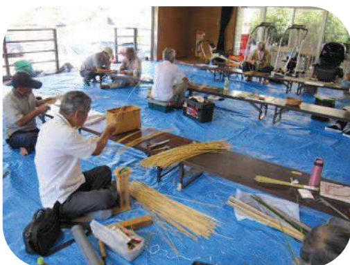
竹かごづくり教室

生涯学習とは、人々が、生涯のいつでも、どこでも、自由に行う学習活動のことで、学校教育や公共施設における講座等の社会教育の学習機会などに限らず、自分から進んで行う学習やスポーツ、文化活動などにおけるさまざまな学習活動をいいます。