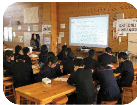
中学校での人権学習