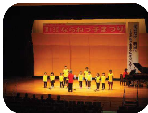
檜根作詞の歌を発表する子どもたち