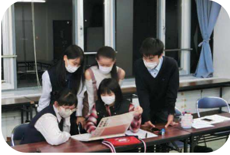
リーダースクール会議の様子