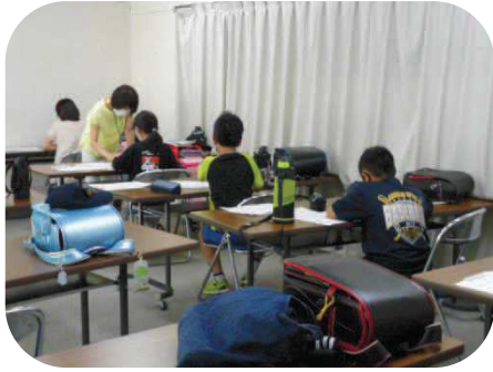
小学生チャレンジ教室 (ゆふの寺子屋・学び)