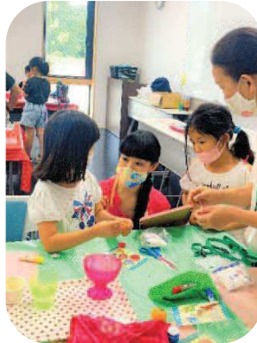
小学生チャレンジ教室 (ゆふの寺子屋・土曜教室)