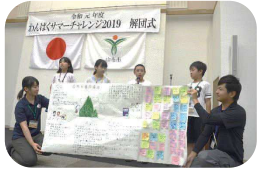
わんぱくサマーチャレンジ