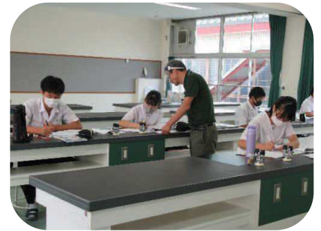
未来創生塾 (中学生学び応援教室)