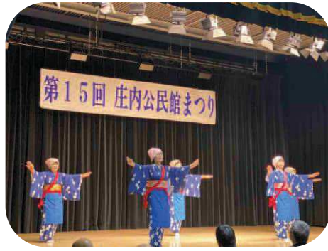
庄内公民館まつり