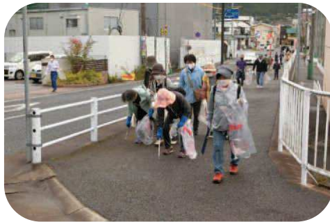
私たちのまちクリーン大作戦