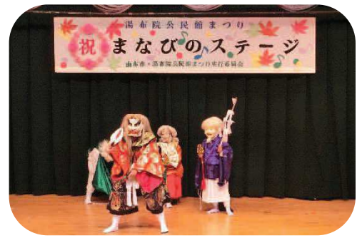
湯布院公民館まつり