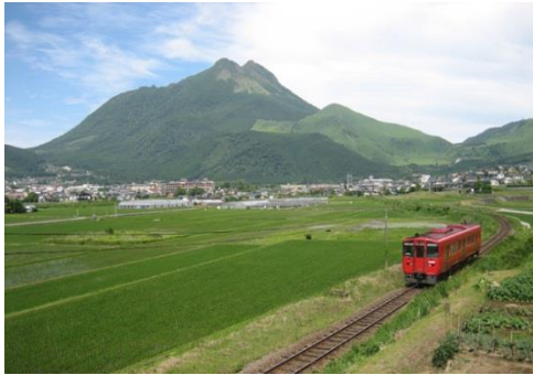
由布岳と由布院盆地