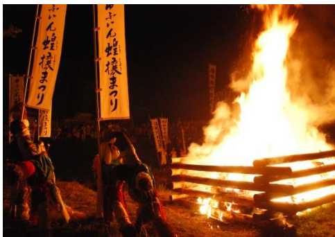
ゆふいん盆地祭り