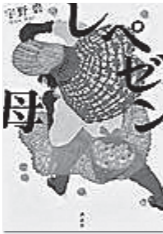
『レベゼン母』 宇野 碧 著 一般 913.6/ウ

夫に先立たれ、梅農家を営む64歳の明子。ある日、離婚と借金の末に行方不明中の息子がラップバトルの大会に出場することを知り、マイクを握り、立ち上がる！おかんと息子の本音をさらけ出した熱い言葉の数々が胸にささる家族小説です。