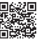
▲申込専用フォーム