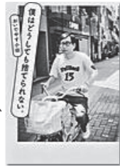
『僕はどうしても捨てられない。』 おいでやす小田 著 一般 779.1/オ

芸人のおいでやす小田さんが、自身の回りにある捨てられないものたちを紹介していく本です。ものをめぐるエピソードは、笑えるものもいっぱい。壊れたとか、破れたとか、何か理由がないと捨てられないというのは共感できる人も多いのではないのでしょうか。