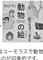
『動物の絵 -日本とヨーロッパ-』 府中市美術館 編著 一般 720.8/ド

日本とヨーロッパの美術作品に描かれる動物への「まなざし」の違いに着目した1冊です。写実的で何かの象徴として描かれることがほとんどだったヨーロッパに対して、日本の絵はユーモラスで動物自体が主役となっているのが印象的です。