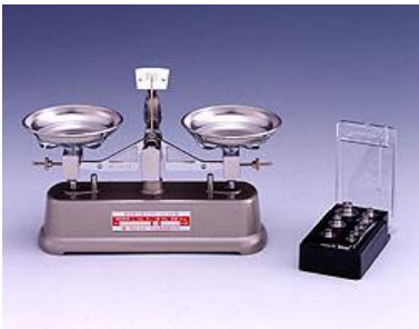
等比皿手動はかり