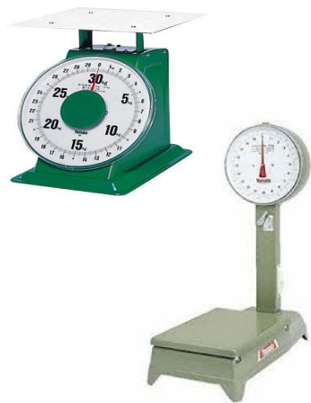
ばね式指示はかり