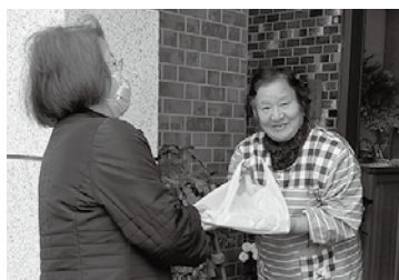
まごころ弁当配布