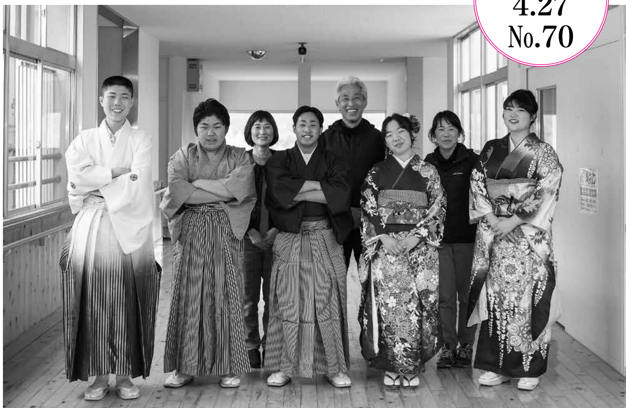
大分県立由布支援学校 着付けプロジェクト