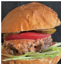
ノマディキッチン