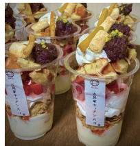
古名家ダイニング hako