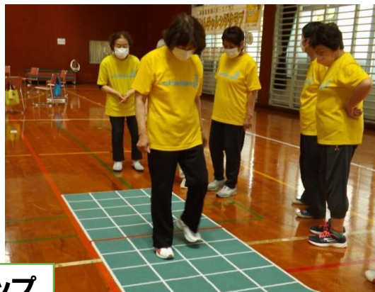
スクエアステップ