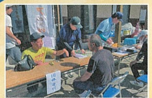
被災地支援 ボランティアの受付