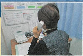
悩み相談を受ける相談員