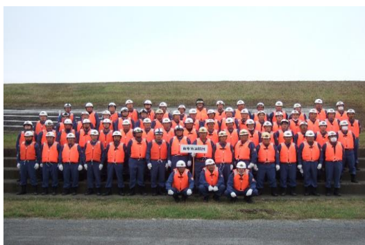
令和4年大分川・大野川水防演習 (R4.5.15)