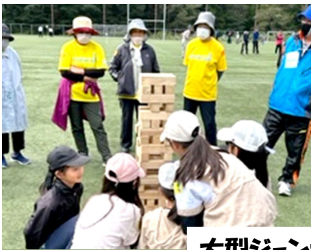
大型ジェンガ みんなで楽しみました