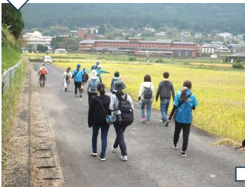
20名の参加者のみなさん