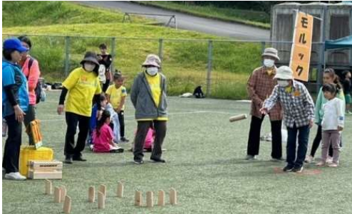
モルック は老若問わず大人気！

ゆふいんスポーツフェス'23の第1弾は、人工芝の上でみんなで楽しくいろいろな軽スポーツを体験しようというイベントです。グラウンドゴルフとサッカーも含めて、目標を大きく上回る約180名の方々が集まってくださいました。キッチンカーも3台登場。大いに賑わいました。