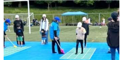
スクエアステップ に小学生も挑戦