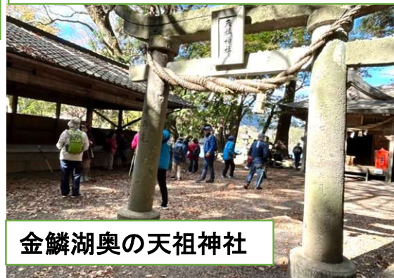
金鱗湖奥の天祖神社

10月14日の裏道ウォーキングと同じコースを歩きました。これまで湯布院を訪れたことのある人ばかりでしたが、このコースは初めてで景色もよく歩きやすかったと好評でした。