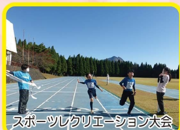
スポーツレクリエーション大会