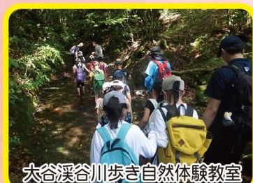
大谷溪谷川歩き自然体験教室