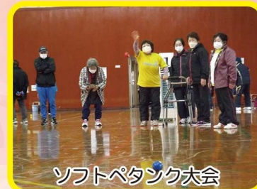
ソフトバタック大会