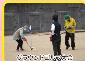
グラウンドゴルフ大会