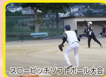
スローピッチソフトボール大会