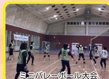
ミニバレーボール大会