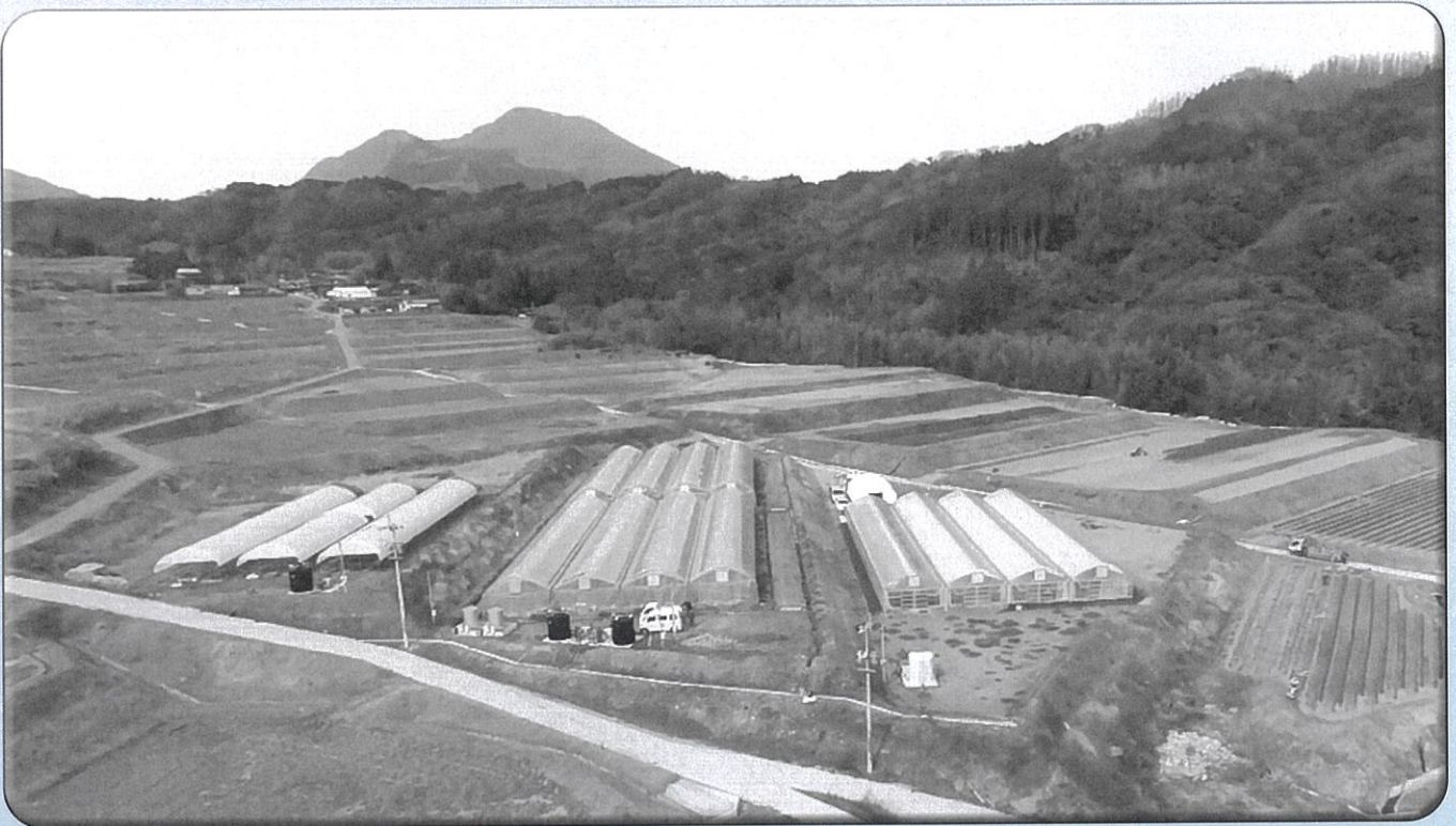
ゆふ農業スタートアップファーム

☆農地の転用を行うには、前もって農業振興地域（農用地区域）からの除外が前提となります。