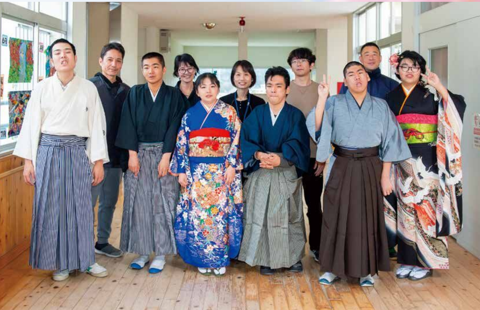
着付けプロジェクト 大分県立由布支援学校