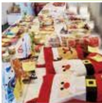
子ども達へのプレゼント

社協では、由布市社会福祉法人施設経営者協議会の協力のもとに、企業様からまだ食べられるのに捨てられてしまう食品を毎月寄贈いただくフードバンク事業を行っています。 また、個人の方から食べきれずに余らせてしまう食品や日用生活品などの寄付をしていただくフードドライブ事業も行っていきます。