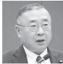
吉村 益則 議員