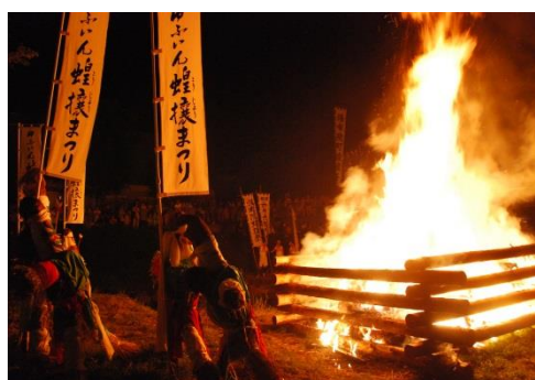
ゆふいん盆地祭り