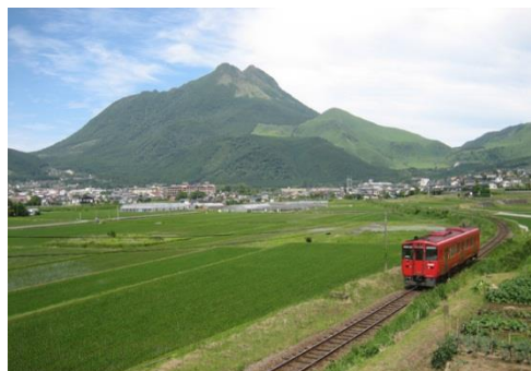
由布岳と由布院盆地