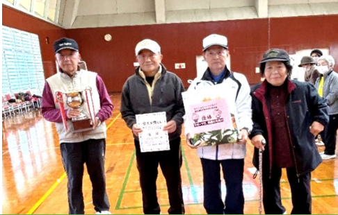
優勝は「テニスクラブ」のみなさん

14チーム50名の方がエントリー。ボールを転がして、的のボールまでの近さを競います。単純なのに思い通りの場所に落とすのは思いのほか難しく(;▽;)それがまた面白い。ボールに回転をつけたり、そろそろと転がしたり、年齢に関係なく楽しめます。