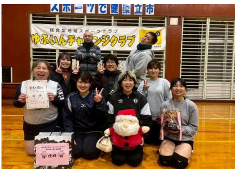
優勝 ペグ (経験者がチームを組んでの初参加)

湯布院町の金融団(大分県信用組合様、豊和銀行様、みらい信用金庫様、大分銀行様)から例年のように参加賞の提供をいただきました。ありがとうございました。