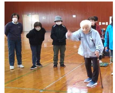
こちらは最年長 93歳