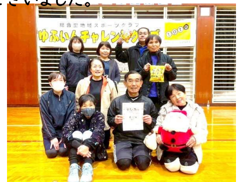
第3位 翔 (湯布院生え抜きのベテランチーム)