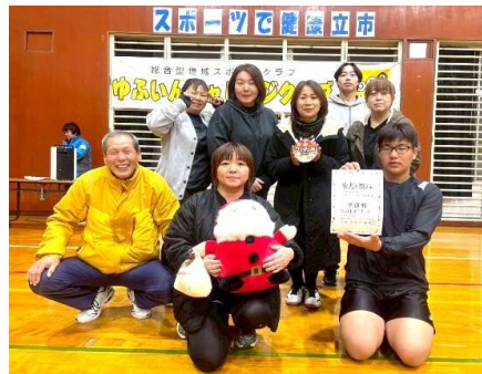
準優勝 ウエストポート (庄内からの参加。ありがとう!)