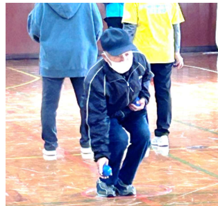
投げるスタイルも10人10色