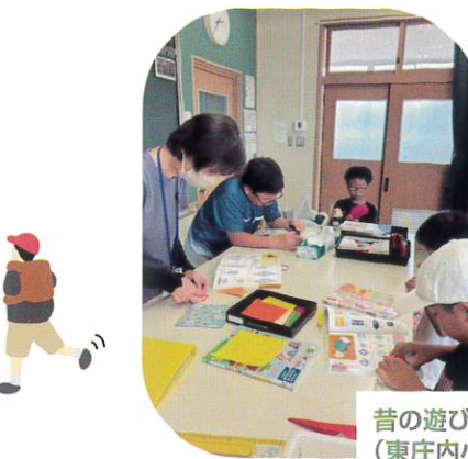
昔の遊び (東庄内小)