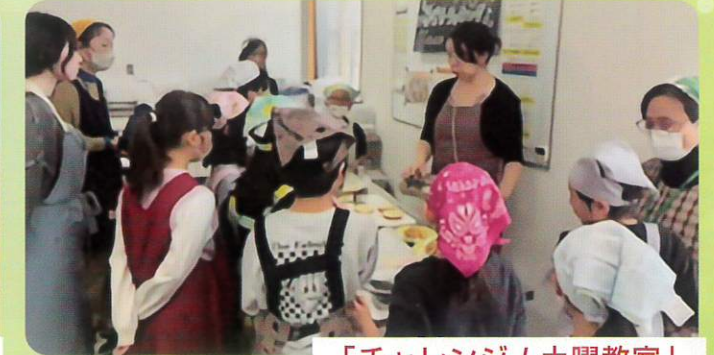
「チャレンジ!土曜教室」

子どもたちの安心安全な活動拠点(居場所)を設け、地域の方々の協力を得て補充学習や多種多様な体験活動、交流活動を実施することにより、心豊かで健やかな子どもの育成を図ることを目的として、「小学生チャレンジ教室」を実施しています。