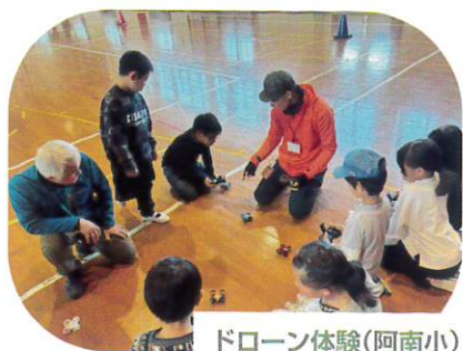
ドローン体験 (阿南小)