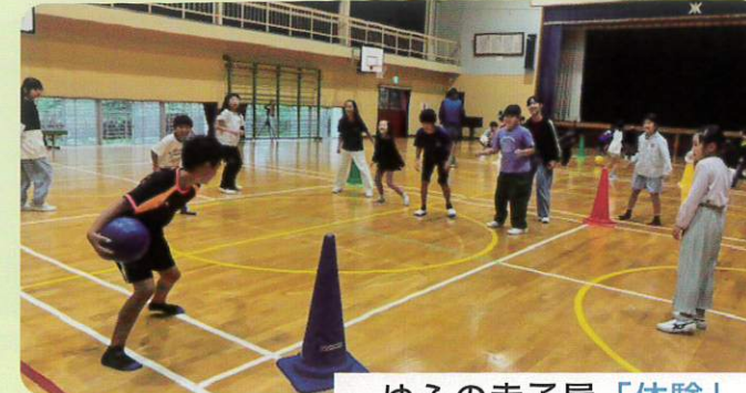
ゆふの寺子屋「体験」