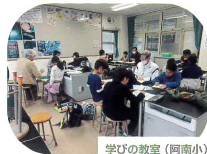
学びの教室 (阿南小)