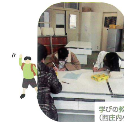
学びの教室 (西庄内小)