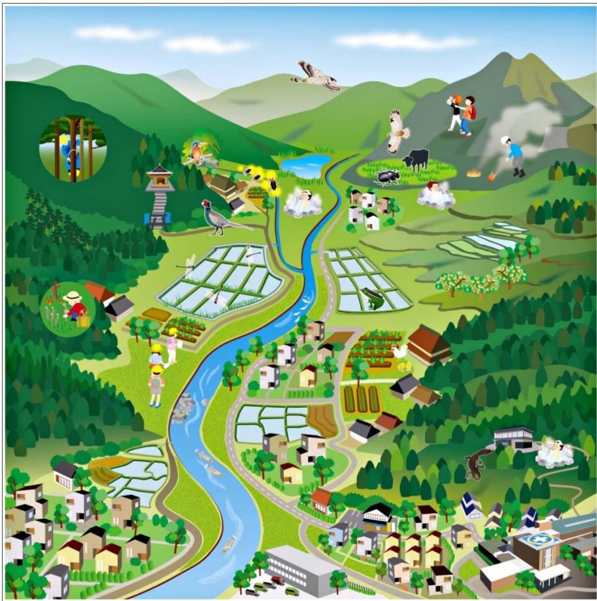
図 28 由布市が目指す環境のイメージ