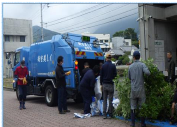
▶湯布院一斉清掃デーの実施