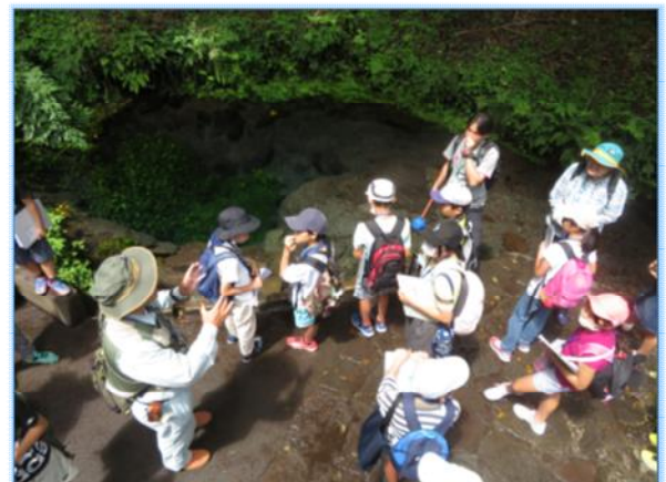
▶男池の自然体験・学習