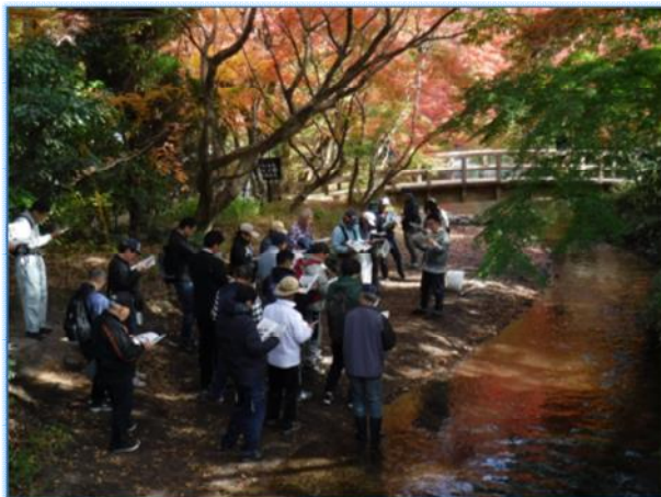
▶市民参加型の水環境調査「ゆふしらべ」