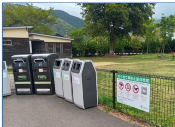
▶「ポイ捨て等防止に関する条例」による重点地域の指定