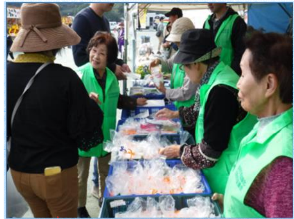
▶地域イベントでの温暖化防止啓発活動