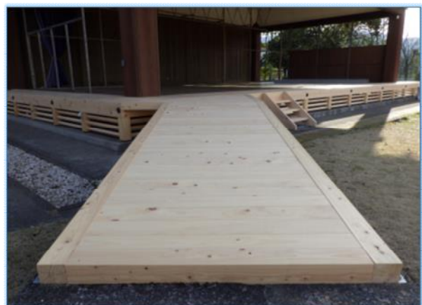
▶県産木材の利活用の促進(神楽殿縁板部分の改修)