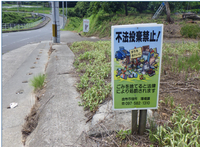
▶不法投棄注意看板の設置