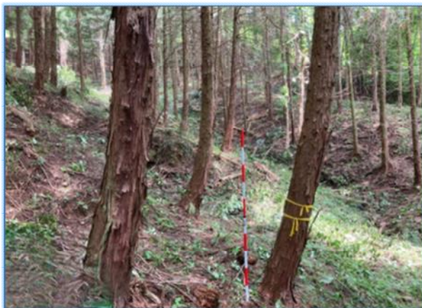
▶森林環境譲与税活用による未整備森林整備事業(間伐)の実施