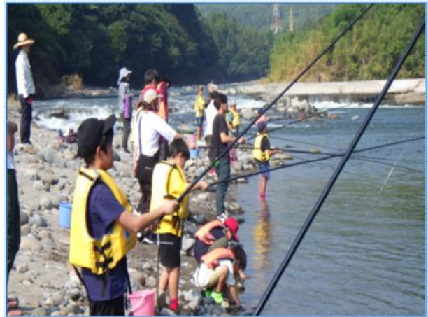
▶流域会議主催による「大分川親子釣り教室」の開催