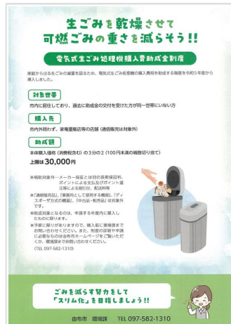
▶ゴミ減量化の啓発