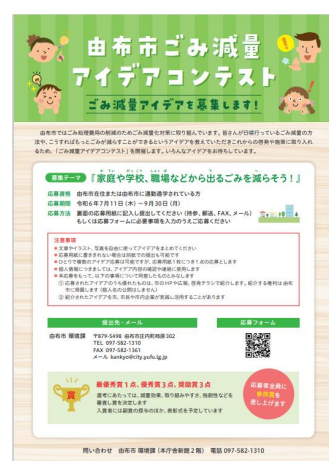
▶ゴミ減量化の啓発