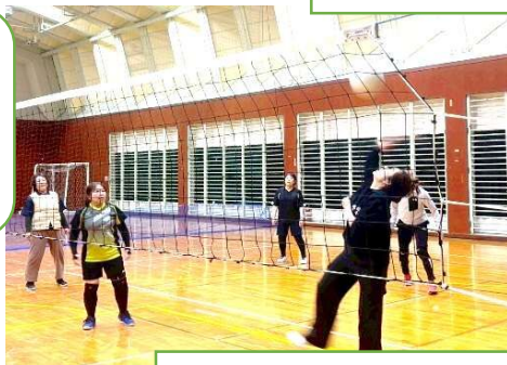
ミニバレーボール教室