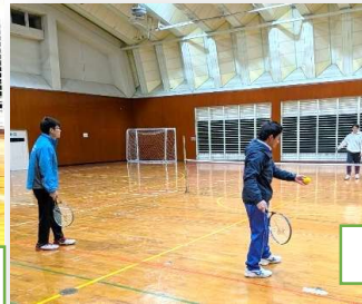
バドミントン教室