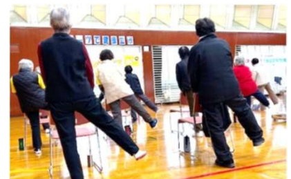
エクササイズはいつも通り