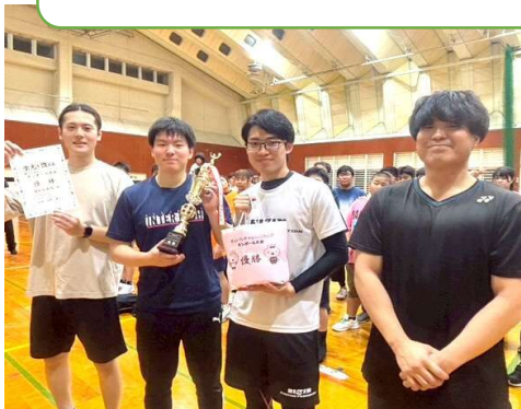
優勝：湯布院病院チーム

職場や友達とチームを作って参加して下さったみなさん、ありがとうございました。9月に2回目の大会を予定しています。ふるってご参加ください。初めての参加の方もぜひぜひお待ちしております。