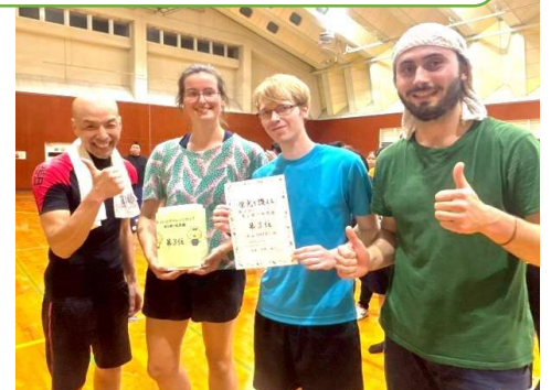
第3位：チームフライデー