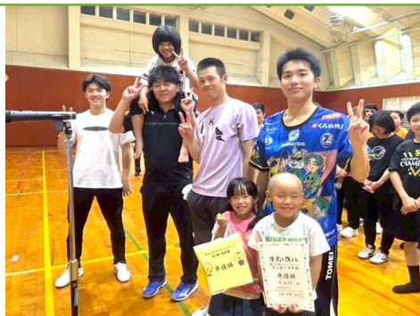
準優勝：チームCF (消防署勤務の方々)