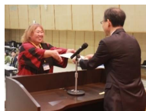
ツーリズム大学修了式にて

地域おこし協力隊の任期は3年。あっという間に、3年目となりました。1年目は、右も左もわからない中、ツアー企画、高校生の起業体験、移住相談会、各種ワークショップなどを行いました。2年目は、移住・定住の広報冊子を作ったり、まちづくり協議会の視察ツアーを企画・運営したり、初めてグラウンドゴルフを体験したり、テレビやラジオに出演したりしました。様々な新しいことに挑戦する中で、どんな時も関わってくださった皆さんが本当に温かく、沢山のアドバイスやご協力をいただき、感謝しかありません。3年目は、さらに新しいことに挑戦します！お楽しみに♪