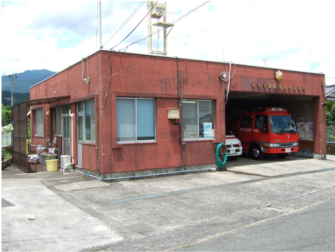
由布市消防署 庄内出張所