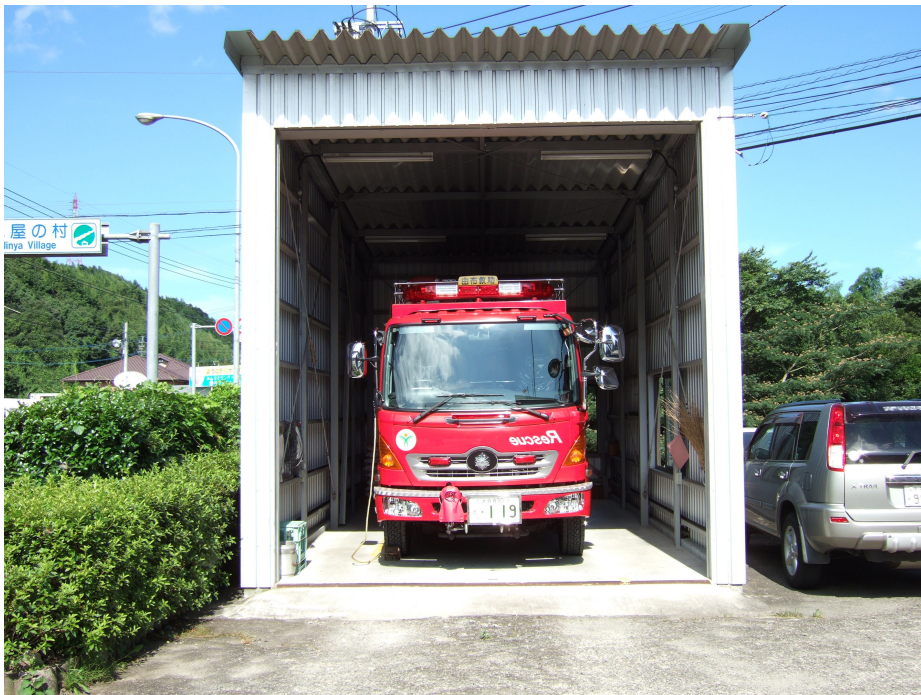
由布市消防本部 由布市消防署