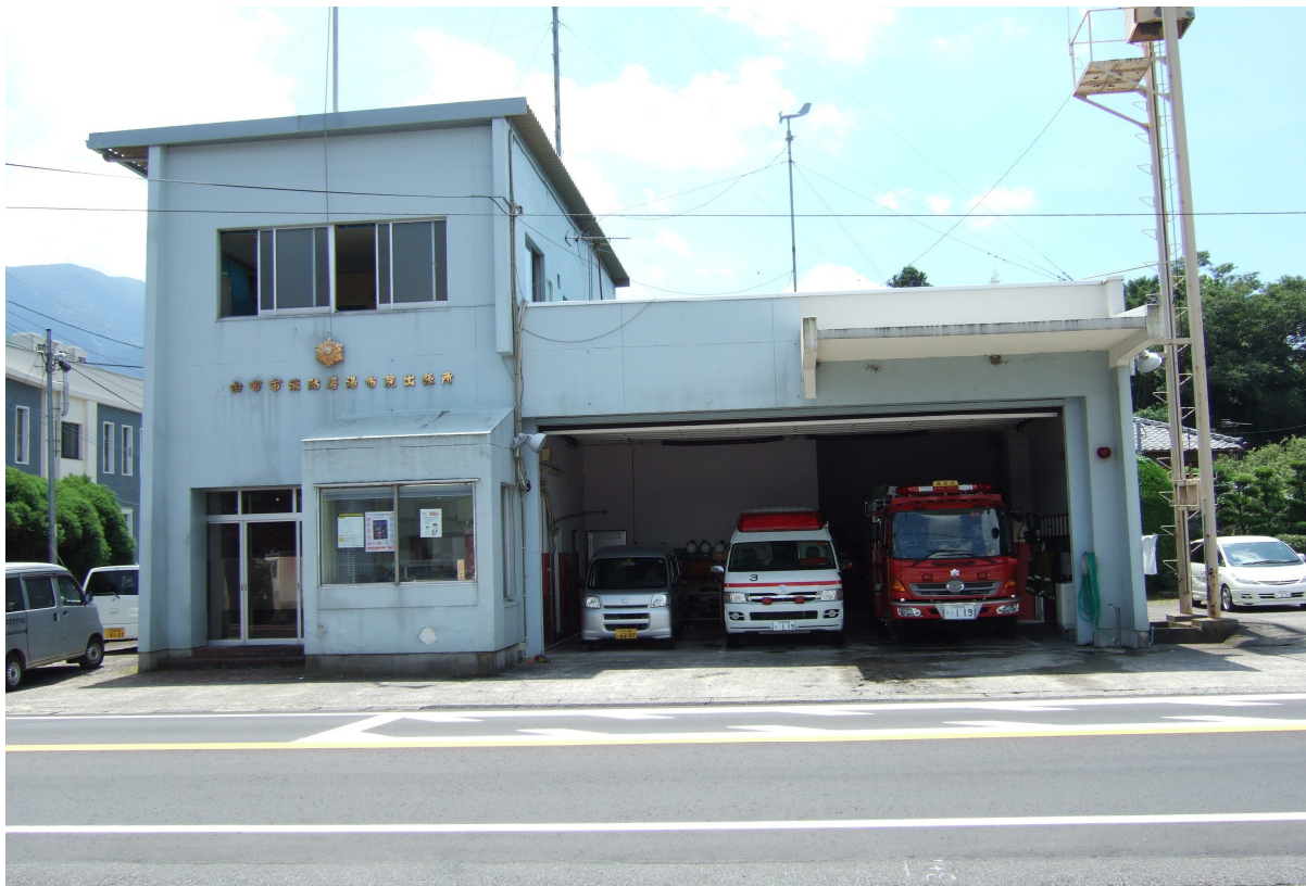
由布市消防署 湯布院出張所