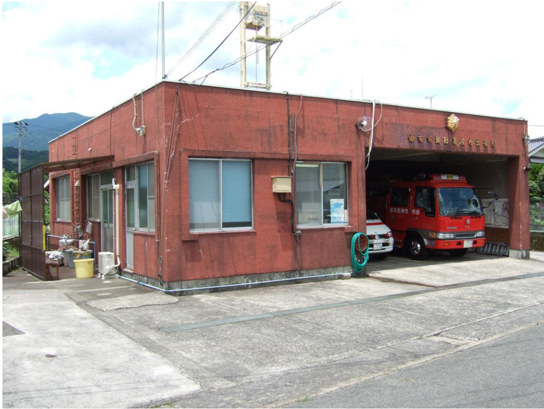
由布市消防署 庄内出張所