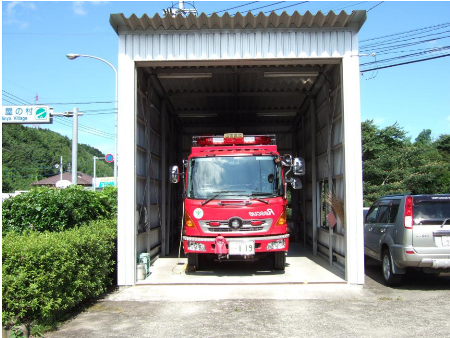
由布市消防本部 由布市消防署