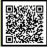
(パソコン・スマートフォン用)