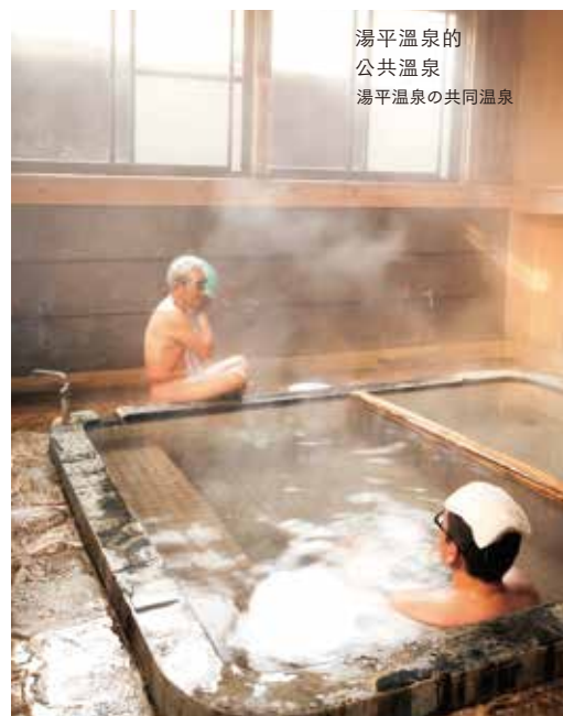
湯平温泉的公共温泉 湯平温泉の共同温泉