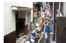
湯平大型流水麵線大會 湯平大ソーメン流し大会