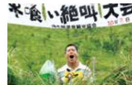
由布院吃牛肉喊叫大會 由布院牛喰い絶叫大会