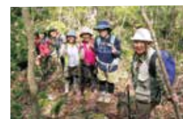
黒岳開山 黒岳山開き