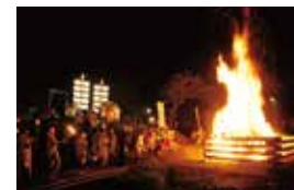
由布院盆地祭 ゆふいん盆地まつり