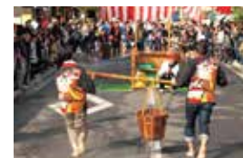
由布院温泉祭 ゆふいん温泉まつり