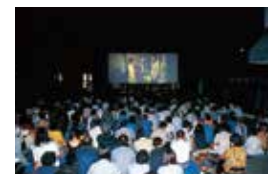
湯布院電影祭 湯布院映画祭