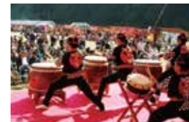
挾間「大家一起來」祭 はさま きちよくれ祭り