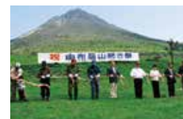
由布岳開山 由布岳山開き