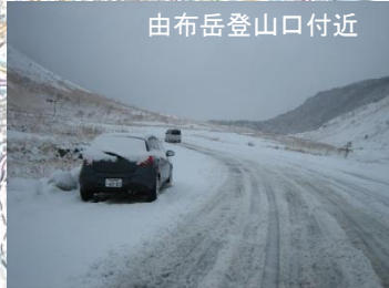
由布岳登山口付近

<由布市内の標高が高い場所マップ> 標高の高い場所の通行は、降雪・路面凍結に注意してください 冬季間は、すべり止めをご用意して通行してください