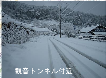
観音トンネル付近