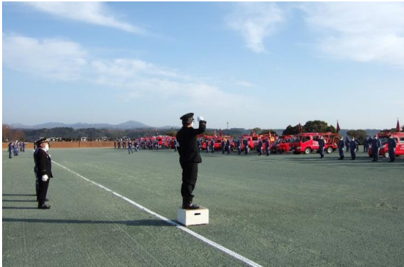
令和3年由布市消防団特別点検 (R3.1.15)