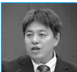
高田 龍也 議員