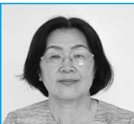
田中 真理子 議員