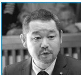
太田 洋一郎 議員