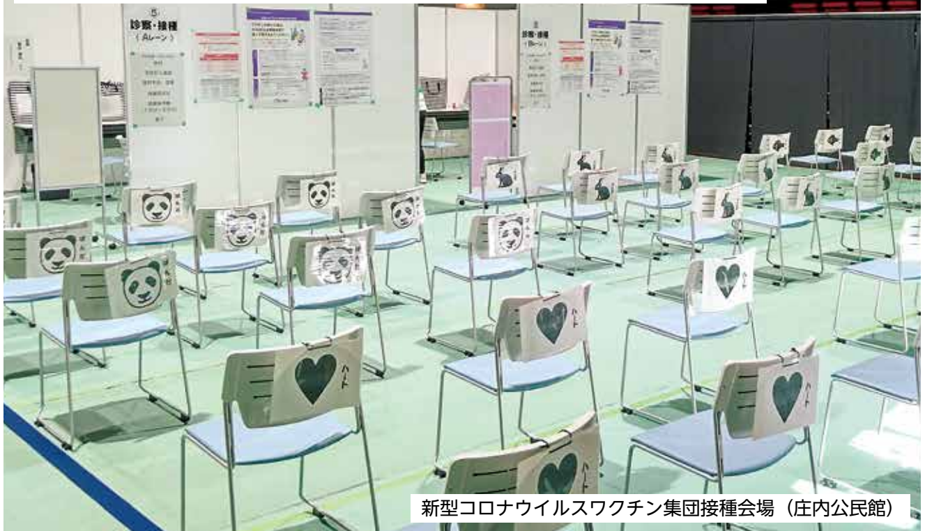
新型コロナウイルスワクチン集団接種会場（庄内公民館）