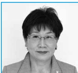
湊野 けさ子 議員